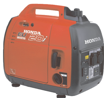
EU20 är extremt tystgående, driftsäkert och uppfyller EU's miljökrav Euro2.

Honda är världens ledande tillverkare av elverk. EU20 är extremt tystgående, driftsäker, har gummifötter för vibrationsfri gång och låg vikt (konstruerad för att bära med sig). Samtliga Hondas elverk uppfyller EU-direktiven gällande elsäkerhet och uppfyller även EU's direktiv Euro2, ett miljökrav som baseras på tidigare EPA (US Environmental Protection Agency). För fler modeller, se www.honda.se